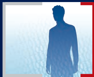
COMMISSION NATIONALE POUR LA PROTECTION DES DONNÉES

41, AVENUE DE LA GARE, L-1611 LUXEMBOURG SIÈGE : L-4100 ESCH-SUR-ALZETTE TÉLÉPHONE : +352 26 10 60 -1 - FAX : +352 26 10 60 - 29