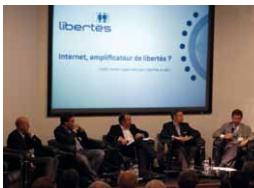
Gérard Lommel à la table ronde "Internet, amplificateur de libertés?" le 23 octobre 2012.