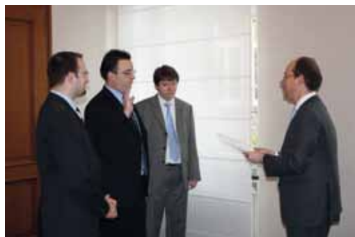
Le 10 avril 2009, Monsieur le Ministre des Communications, Jean-Louis Schiltz, a procédé à l'assermentation de trois nouveaux juristes. MM. Georges Weiland, Michel Sinner et Christian Welter.

L'écoute ainsi rencontrée de plus en plus souvent à un stade précoce du processus de décision gouvernemental ou administratif était ressentie comme l'une des grandes satisfactions. Les deux autres sources de satisfaction étaient l'adoption par la Chambre des députés de la loi