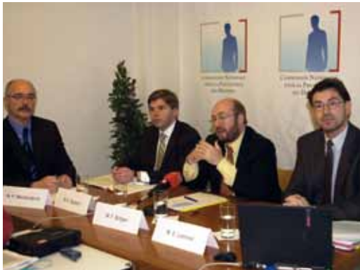
Une conférence de presse de présentation de la Commission nationale a eu lieu à Esch-sur-Alzette le 12 décembre 2002 en présence du ministre délégué aux Communications, François Biltgen.

Ce n'était pas le cas pour la loi sur la protection des données qui était considérée comme secondaire même si les deux lois se trouvent sur un pied d'égalité. C'était le rôle de la Commission nationale de dire qu'il s'agit d'une loi comme une autre et qu'il y aura des conséquences en cas de non-respect. » 7