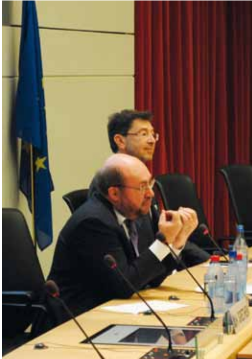
Discours de François Biltgen à la Spring Conference, 2 mai 2012.

François Biltgen espère qu'on pourra faire émerger une véritable culture de la protection des données : « Dans cette nouvelle culture, les autorités nationales doivent jouer un rôle clé comme le prévoit le projet de la Commission. La protection des données est devenue un réel sujet de débat dans la société civile, les enjeux quotidiens et la prise de conscience des citoyens augmentée. Je m'en félicite.