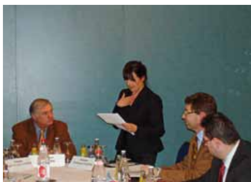
Table ronde « Mesurer les diversités » du 9 avril 2009 à l'hôtel le Royal avec le Président de la CNIL Alex Türk et des représentants du Commissariat aux Étrangers (aujourd'hui OLAI) et du Centre de l'égalité de traitement.

Les formations, conférences et séminaires représentent un autre moyen pour la Commission nationale d'informer un public plus spécialisé sur les enjeux de la protection des données.